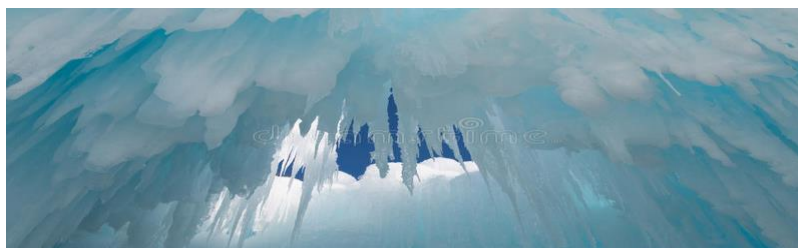
El techo de hielo